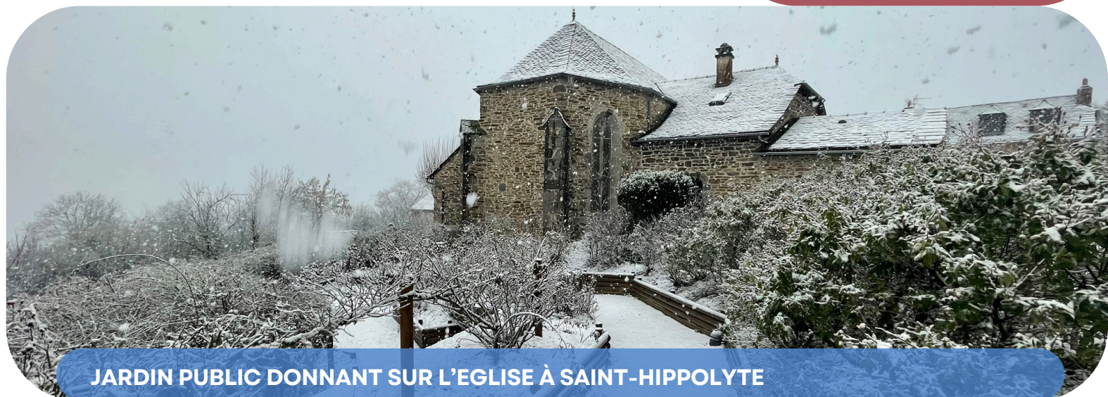
JARDIN PUBLIC DONNANT SUR L'EGLISE À SAINT-HIPPOLYTE